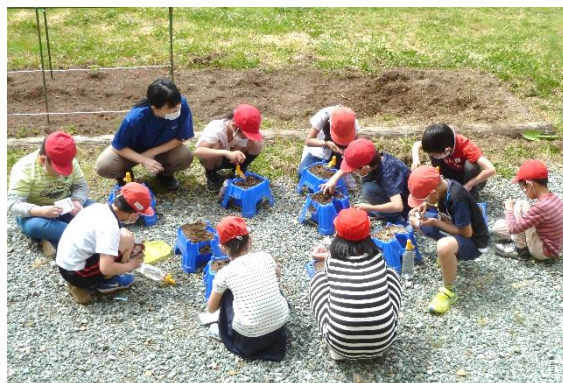
3年理科「たねをまこう」

学校では、職員の学習指導力の向上を図るため、4月から「校内研究全体計画」に基づき、全職員で取り組んでいます。加えて今年度は、村山教育事務所の「学力支援アドバイザー」お二人を迎える研修会を設け、授業力の向上により、児童に「確かな学力」が育つ授業づくりを進める予定です。6月12日（金）の第1回学校訪問では、全ての学級の授業を見ていただきました。第2回は7月2日、第3回は1月28日と、計3回の訪問でたくさんアドバイスをいただきながら、児童が時間を忘れるような魅力ある授業をめざします。