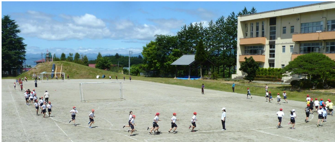
「体づくりウィーク(6/15～26)」5分間走に挑む全校児童

9月の秋季大運動会は、徒競走以外の種目内容と進行予定を見直し、今にふさわしい運営を考えています。10月末の学習発表会（どんぐり発表会）における保護者の参観は、子供さんの学年のみをご覧いただくことを想定しています。「児童の健康を守ること」と「教育活動を守ること」の両立は確かに難しく、多くの皆さんのお知恵をお借りしつつ、日々考えを巡らしながらあるべき姿を模索していきます。